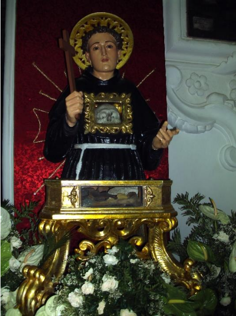
Cropani: L'immagine taumaturgica con i resti mortali del Beato Paolo.

di pace interiore con Dio e con i propri fratelli. Le memorie locali si limitano, però, a ricordare l'apostolato da lui esercitato prima a Cropani e poi a Scavigna, a servizio dei tanti che ricorrevano a lui.