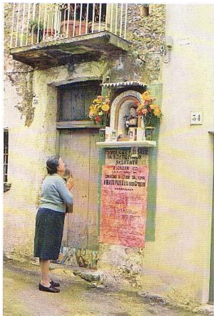
Cropani: Una devota del Beato Paolo prega davanti alla sua casa natale.