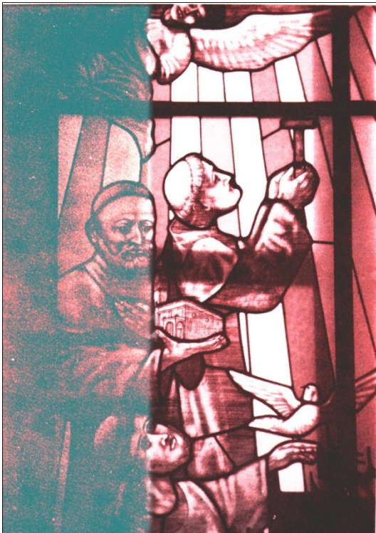
Assisi: Convento S. Antonio. Il Beato Paolo annuncia la penitenza e la pace.

Con le parole e con i fatti, il Divino Maestro lo aveva insegnato: Se vuoi essere perfetto, rinuncia a tutto ciò che hai, poi vieni e seguimi.