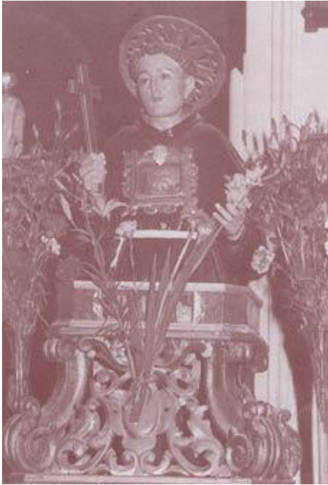
Cropani: L'immagine taumaturgica con i resti mortale del Beato Paolo.

di pace interiore con Dio e con i propri fratelli. Le memorie locali si limitano, però, a ricordare l'apostolato da lui esercitato prima a Cropani e poi a Scavigna, a servizio dei tanti che ricorrevano a lui.