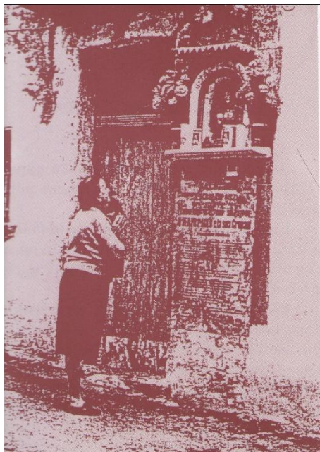
Cropani: Una devota del Beato Paolo prega davanti alla sua casa natale.

Beato; Marco Biondo di Misuraca asciugò con un panno il sudore che emanava dal volto del Beato Paolo e con questo panno, tornato a casa, toccò il viso di sua figlia già